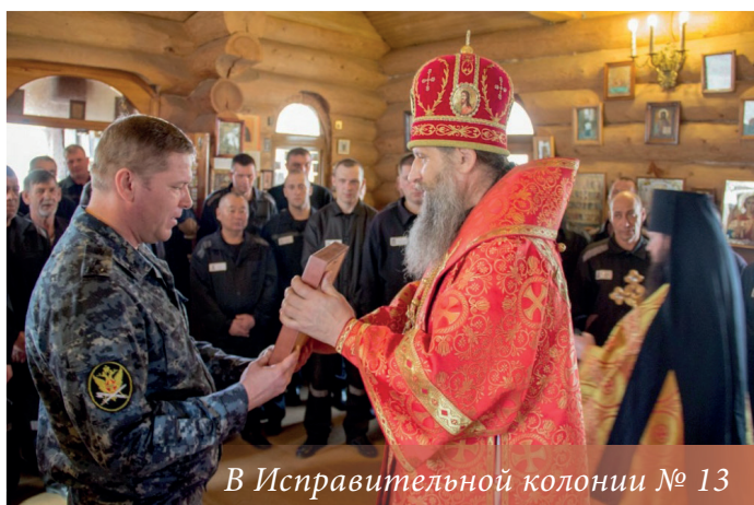
В Исправительной колонии № 13