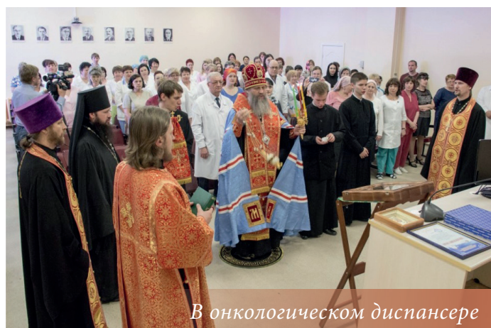
В онкологическом диспансере